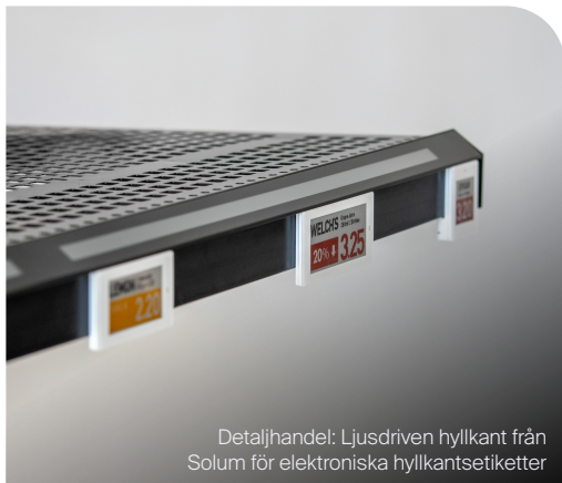
Detaljhandel: Ljusdriven hyllkant från Solum för elektroniska hyllkantsetiketter