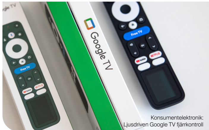
Konsumentelektronik: Ljusdriven Google TV fjärrkontroll