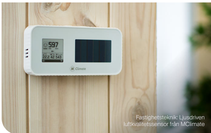
Fastighetsteknik: Ljusdriven luftkvalitetssensor från MClimate