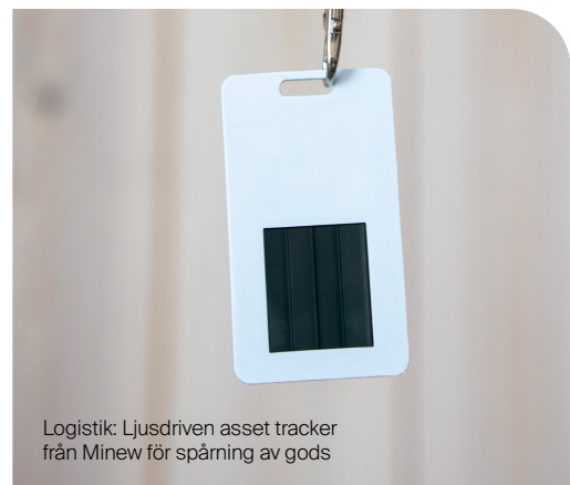
Logistik: Ljusdriven asset tracker från Mineo för spårning av gods

lösningar minskat manuellt arbete, färre driftstörningar och en tydligt reducerad kostnad och miljöpåverkan över systemets livslängd.